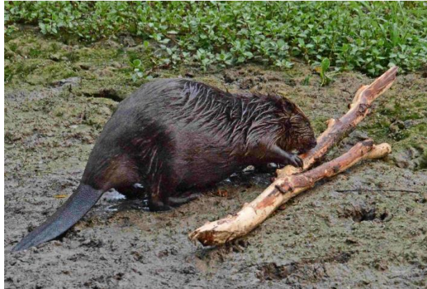
Biber Telli