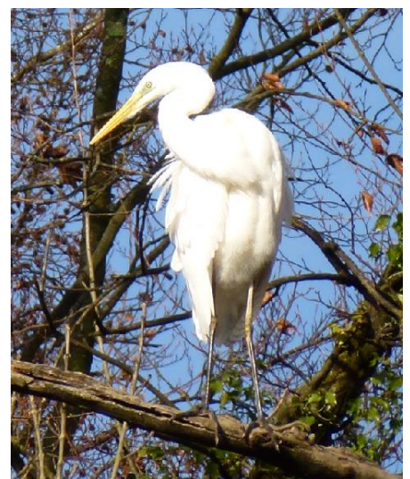
Silberreiher im Schachengebiet