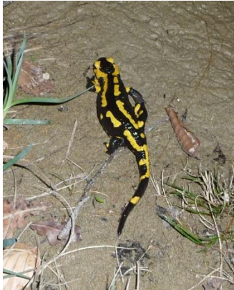
Feuersalamander Kiesweiher Auengebiet