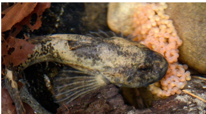
Groppe, die ihr Gelege im Neunäuglerbach bewacht