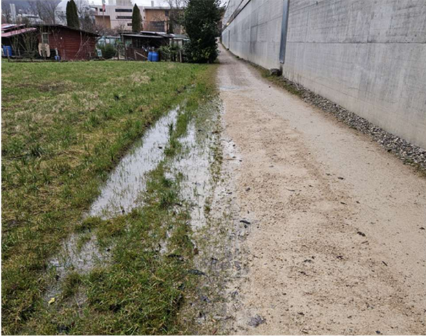
Bild: Temporär wasserführendes Karrengeleis neben dem Werkhofgebäude

Aktuell versuchen wir vom Bachverein mit Hilfe des Werkhofes, den Tieren wieder einen typischen Lebensraum zur Verfügung zu stellen und hoffen, dass die wanderfreudigen Gelbbaunken ihn auch finden. Es soll nicht bei dem einen bleiben, schön wäre es, auch den Weiher beim Telli-Treff so zu unterhalten, dass den Tieren offene, sonnige und flache Uferpartien zur Verfügung stehen. Weitere periodisch wasserführende Tümpel wären erwünscht.